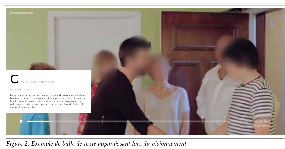
Figure 2. Exemple de bulle de texte apparaissant lors du visionnement